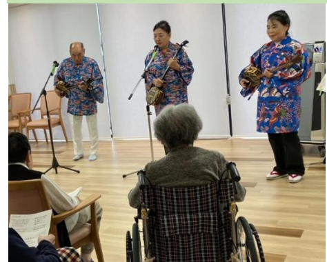
琉球民謡 三味線ハイビスカスさん