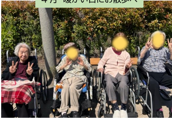
4月 暖かい日にお散歩へ