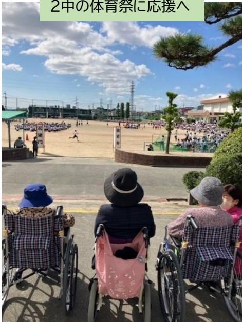
2中の体育祭に応援へ