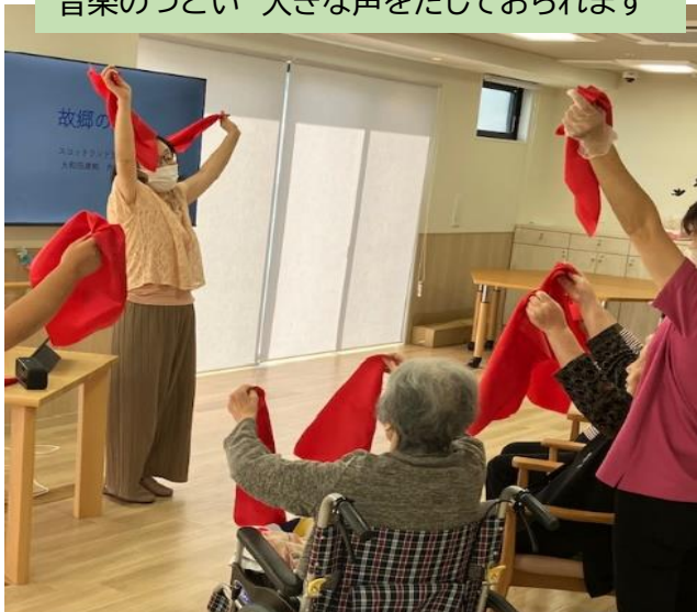
音楽のつどい 大きな声をだしておられます