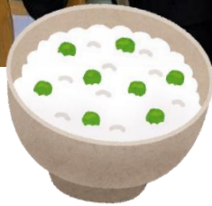
新鮮なので灰汁があまりでません