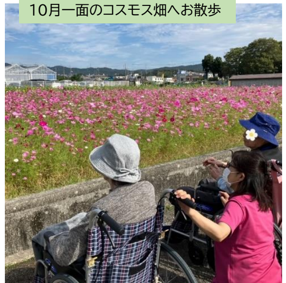
10月一面のコスモス畑へお散歩